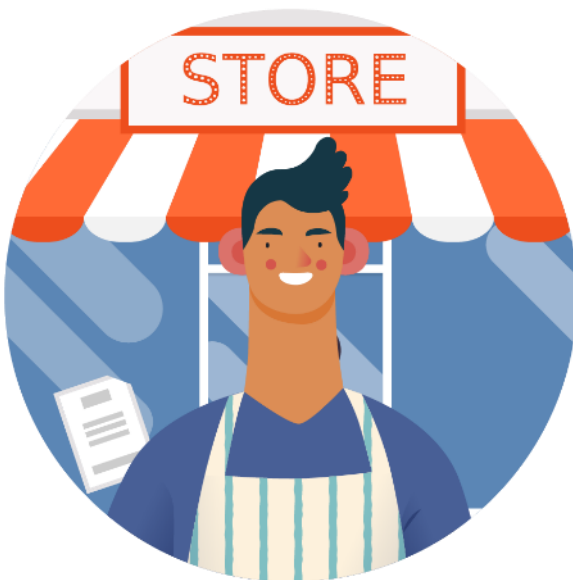
縣市政府所轄市場