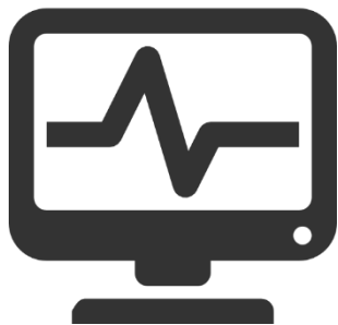
電算中心校務系統