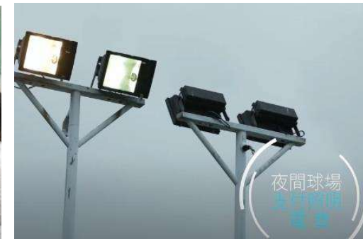
夜間球場支付照明電費