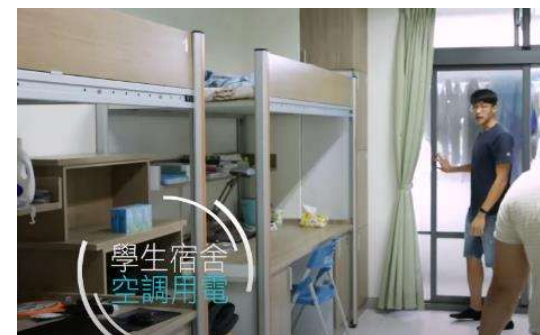
學生宿舍空調電力付費