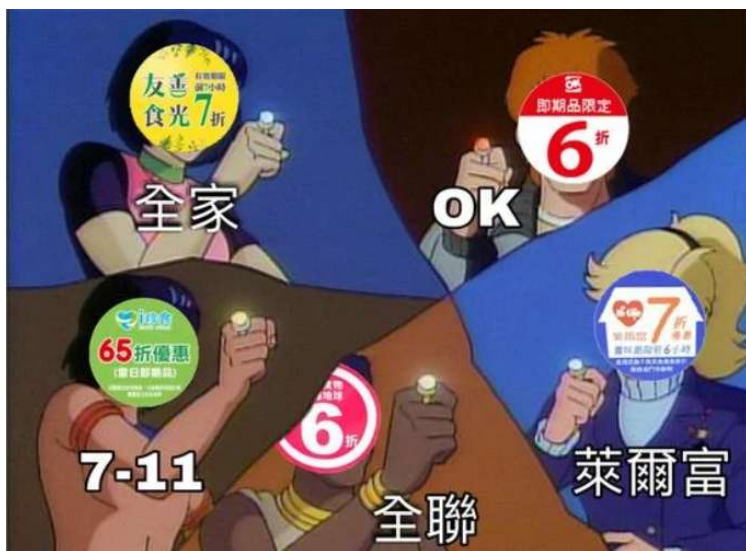
(網路惜食超人梗圖)

7-11 i珍食 / 全家 友善食光 萊爾富 惜福食堂 / OK超商 即期優惠 全聯 惜食地圖