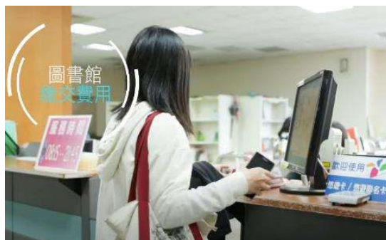
圖書館、場地租借 費用繳交