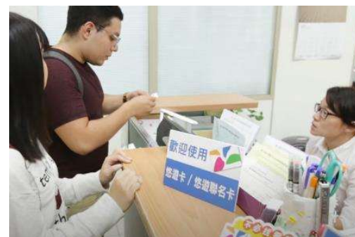
文件申請費用繳交