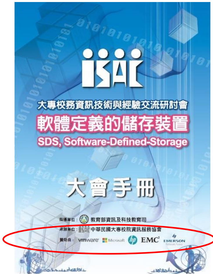
研討會大會手冊封面，列示參展商之 Logo