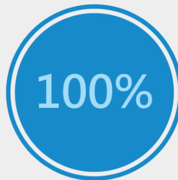
石門水庫(新北、桃園、新竹)

有效蓄水量：20387.57萬立方公尺 昨日水量上升：0.04% 預測剩餘天數：---- 更新時間：2021-09-22(15時)